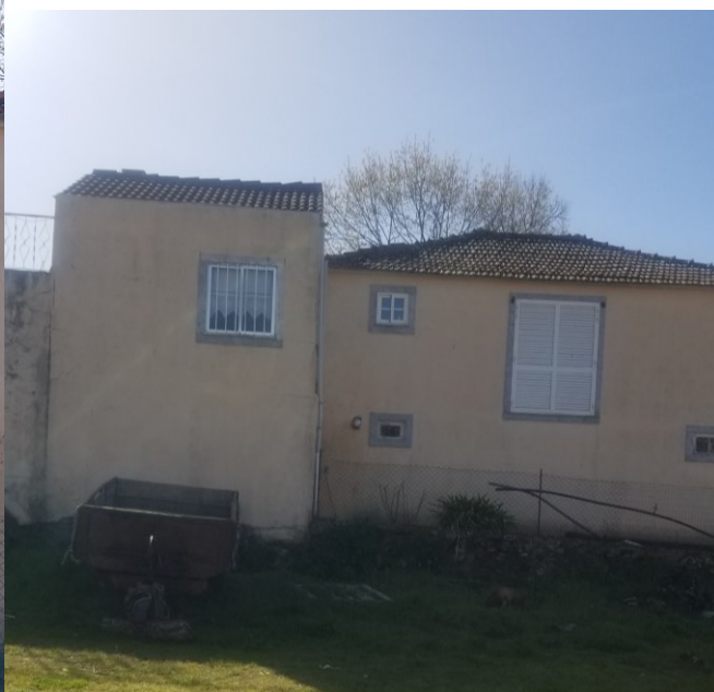
JANELA EDIFÍCIO VIZINHO

Requerente: JUNTA DE FREGUESIA DE CIMBRES